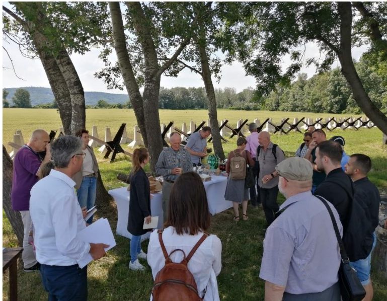
Outdoorový workshop 14.06.2022 na tému "Border Histories" pri Bunkri BS-4 pri hraničnom priechode Berg/Petržalka.

V predchádzajúcom projekte baum2020 sme sa začali venovať aj téme kultúry, vďaka čomu sme mohli iniciovať sériu spoluprác v rámci programu Interreg SK-AT v tejto tematickej oblasti (pri príležitosti Dolnorakúskej krajinkej výstavy a na tému rímskeho dedičstva). Vďaka týmto úspechom bola kultúra zaradená medzi tematické ťažiská projektu baum_cityregion; konkrétne sme sa na celkovo 10 pracovných stretnutiach v roku 2022 venovali kultúrnej spolupráci medzi aktérmi z hl. m. SR Bratislava a rakúskeho regiónu južne od Dunaja (geograficky ide o rakúske okresy Bruck an der Leitha a Neusiedl am See).