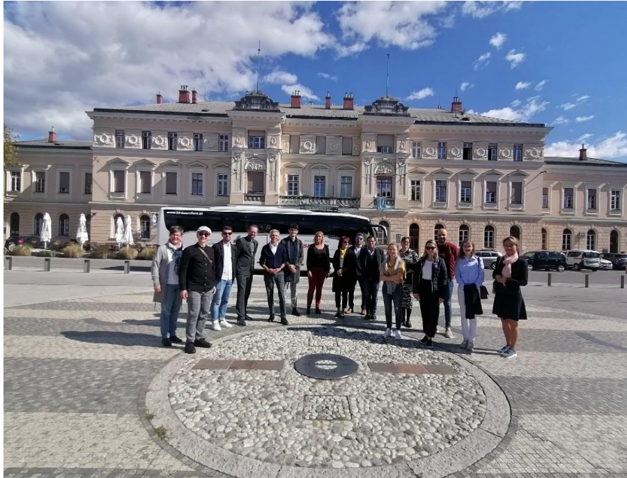
Burgenlandsko-dolnorakúsko-slovenská delegácia na slovinsko-talianskej štátnej hranici

Súčasnú snahu o prípravu založenia cezhraničného mestského regiónu Bratislava-okolie boli príležitosťou na exkurziu do taliansko-slovinského mestského regiónu Gorizia s približne 70 000 obyvateľmi, ktorý už podnikol niekoľko krokov k inštitucionalizácii. V dňoch 21. až 23. septembra 2022 preto 15-členná delegácia mestského regiónu Bratislava-okolie navštívila spojené mestá Gorizia (Taliansko) a Nova Gorica (Slovinsko). Odbornú cestu zorganizovala Wirtschaftsagentur Burgenland.