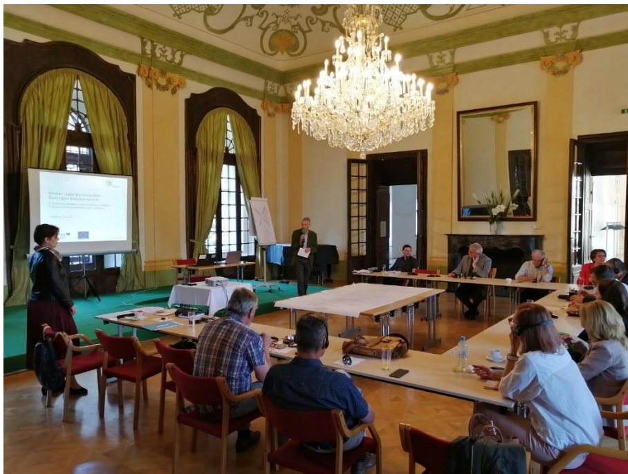
Slovensko-rakúske stretnutie starostiek a starostov v cisárskom prostredí zámku Kittsee 11. mája 2022

baum_cityregion sa považuje za relevantnú sieťovú platformu pre starostky a starostov z cezhraničného mestského regiónu Bratislavy a okolia. V roku 2022 sa uskutočnili dve slovensko-rakúske stretnutia starostiek a starostov. Dňa 11. mája 2022 sa na zámku Kittsee konalo prvé stretnutie, ktoré sa venovalo stratégii baum2023+: boli predstavené doterajšie výsledky procesu tvorby stratégie baum2023+ a obce a mestské časti regiónu baum mali možnosť predniesť svoje doplnujúce návrhy. Potom nám hasiči z Kittsee a Bergu poskytli kyvadlovú dopravu na vyhliadkovú vežu na Königswarte (ktorá je považovaná za najvyššiu vrch v Rakúsku a ponúka krásny výhľad na Bratislavu). Druhé stretnutie starostiek a starostov sa uskutočnilo 30. novembra 2022 v Primaciálnom paláci v bratislavskom Starom Meste – na stretnutí bol predstavený priebeh a výsledky projektu Interreg SK-AT baum_cityregion a výhľad pokračovania aktivít baum_cityregion v roku 2023.