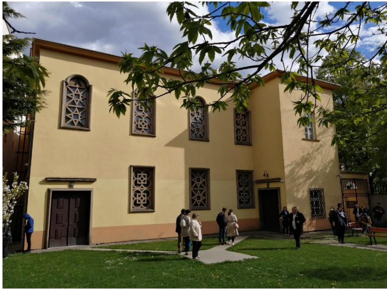
Synagóga na Heydukovej ulici (na snímke) a pamätník Chatama Sofera boli na programe Border Walks 24.04.2022.

Paralelne s procesom rozvíjania kultúrneho regiónu baum-juh zorganizovalo hl. mesto SR Bratislava v apríli a máji 2022 tri tzv. Border Walks pre širokú verejnosť – dvojjazyčné prechádzky so sprievodcom. V nadväznosti na myšlienku Stredoeurópskej židovskej kultúrnej cesty sa pozornosť sústredila na židovské dedičstvo regiónu: jedna prechádzka bola venovaná Starému mestu Bratislavy, kde stále žije veľmi aktívna židovská komunita; druhá prechádzka viedla na starý židovský cintorín v Kittsee, ktorý je dnes nemou spomienkou na kedysi veľkú židovskú komunitu. Ďalšia prechádzka sa uskutočnila v mestskej časti Bratislava-Rusovce a zamerala sa na bohaté rímske dedičstvo tejto mestskej časti s kastelom Gerulata. Cieľom prechádzok je upozorniť na menej známe miesta s veľkým potenciálom v cezhraničnom kontexte.