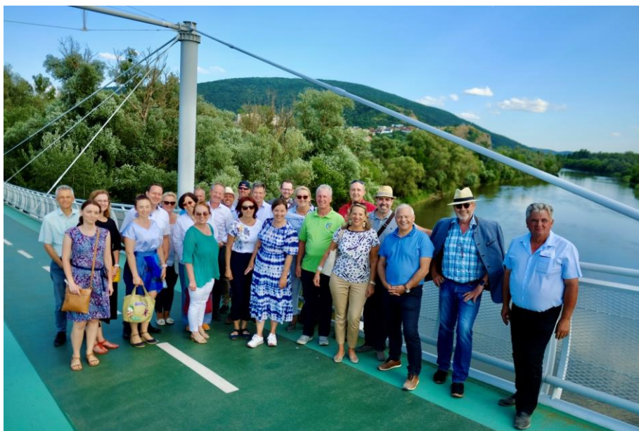
Účastníčky a účastníci stretnutia starostiek a starostov

Nadväzujúc na tradíciu predchádzajúceho projektu baum2020 sa 30. júna 2021 uskutočnilo v Bratislave prvé bilaterálne stretnutie starostiek a starostov po dlhej pandemickej prestávke (posledné takéto stretnutie sa konalo v decembri 2019 v Deutsch-Jahrndorfe v Burgenlandsku). Zúčastnilo sa na ňom približne 30 ľudí, mnohí z nich boli starostovia a starostky prihraničných bratislavských mestských častí, ako aj starostovia z dolnorakúskych a burgenlandských obcí obklopujúcich slovenskú metropolu. Stretnutie sa začalo priamo na štátnej hranici, na slovenskej strane pri bunkri BS-8 v mestskej časti Bratislava-Petržalka. Toto výnimočné miesto stretnutia bolo vybrané preto, že v najbližších rokoch tu súkromný investor plánuje vybudovať v okolí bunkra z medzivojnového obdobia novú mestskú štvrť pre niekoľko tisíc obyvateľov. V rámci výstavby novej mestskej štvrte bude bunker a jeho okolie