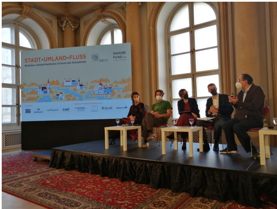
Pódiová diskusia v rámci Konferencie Bratislava a okolie o zhodnotení a revitalizácii riečnych území.

Mesto Bratislava, Dunajský fond, NÖ.Regional a Wirtschaftsagentur Burgenland boli 23. 11. 2021 hostiteľom hybridného podujatia "Mesto - Rieka - Krajina". Na podujatí sa zúčastnilo približne 200 ľudí, z toho asi 50 priamo v Primaciálnom paláci v bratislavskom Starom Meste. Podujatie spojilo dva nezávislé formáty "Konferencia Bratislava a okolie" (projekt Interreg SK-AT baum_cityregion) a "Fórum Dunajského fondu". Celé podujatie sa nieslo v duchu témy "mesto – rieka - krajina". Diskutovalo sa o prírodných oblastiach na osídlených územiach: Ako ich možno zachovať a chrániť? Akú úlohu zohrávajú kooperácie?