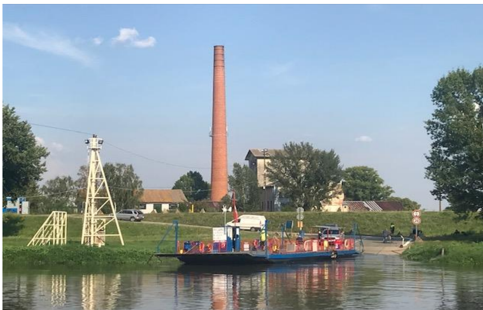
Kompa cez hraničnú rieku Morava pri Angern a.d. March / Záhorská Ves

Vypracovanie tejto štúdie zadalo mesto Bratislava firme Arding s.r.o. vo februári 2021. Cieľom je preskúmať podmienky pre udržateľný cestovný ruch na Dunaji, Morave a Litave (kanoe/kajak) v pohraničnej oblasti a poukázať na možnosti zlepšenia. Konkrétne išlo napríklad o identifikáciu vhodných pozemkov na výstavbu potenciálnych prístavísk. Štúdia sa zameriavala na hraničnú rieku Morava, analyzované však boli aj úseky na Dunaji ako aj situácia