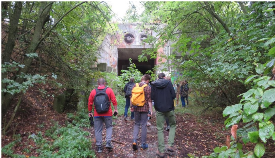
Border Walk k bývalej raketovej základni Československej ľudovej armády