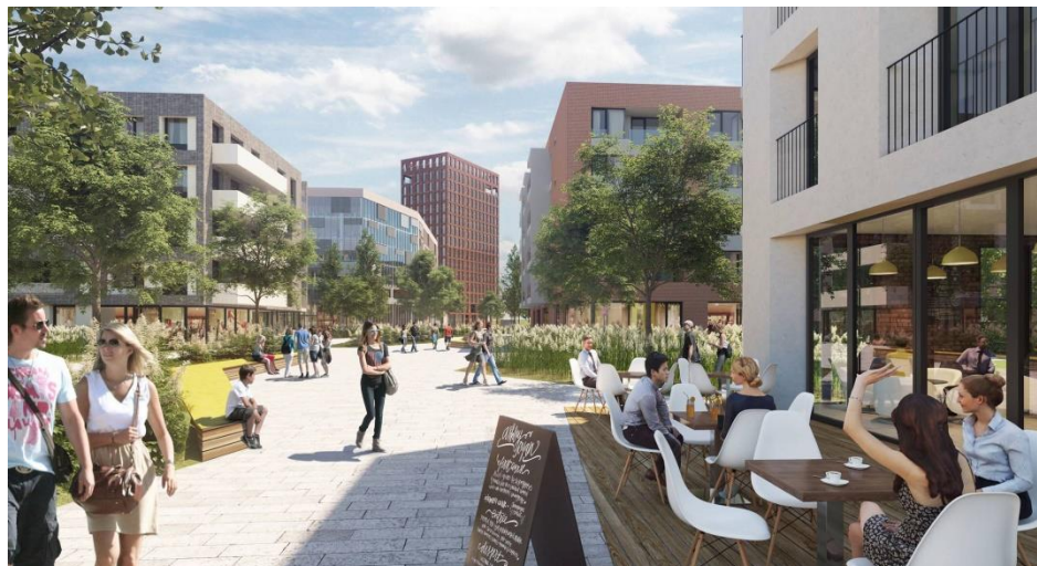
Vizualizácia etapy 1 stavebného projektu „Nesto“ na Kopčianskej ulici

Ako bolo uvedené už v správe o činnosti z uplynulého roka, v zelenom páse pozdĺž hranice Bratislavy s Rakúskom sa nachádzajú prednostne chránené územia a zelené plochy, jedine v mestských častiach Petržalka a Jarovce je možná zástavba takmer až po štátnu hranicu. Doterajšia stavebná činnosť sa tu však doteraz sústreďovala iba po diaľnicu D2 (pri pohľade zo slovenskej strany). Toto sa však má zmeniť projektom „Nesto“ developera Lucron: V prvej etape je naplánované zriadenie novej mestskej štvrte pre cca 4.000 obyvateľov v Petržalke v bezprostrednej blízkosti štátnej hranice pri obci Kittsee (medzi