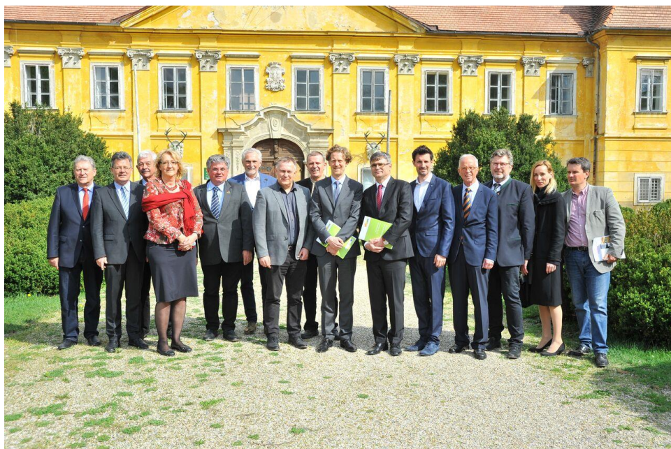
Účastníci stretnutia pracovnej skupiny „Región kultúry BAUM“ v Marcheggi

Prvé stretnutie pracovnej skupiny v tematickej oblasti „Miestna spolupráca“ sa uskutočnilo 17. apríla 2018 v Marcheggi. Spoločne ho zorganizovali Rakúsko-slovenská spoločnosť, LEADER Region Marchfeld a NÖ.Regional.GmbH. Na stretnutí sa zúčastnili vysokopostavení predstavitelia – rakúsky veľvyslanec na Slovensku, slovenský veľvyslanec v Rakúsku, prezident Rakúsko-slovenskej spoločnosti, starostovia z regiónu Marchfeld/Moravské pole a starostovia mestských častí Devín a Devínska Nová Ves. Výsledkom tohto stretnutia je spolupráca medzi LEADER Region a Múzeom mesta Bratislava v rámci Dolnorakúskej krajinkej výstavy 2022.