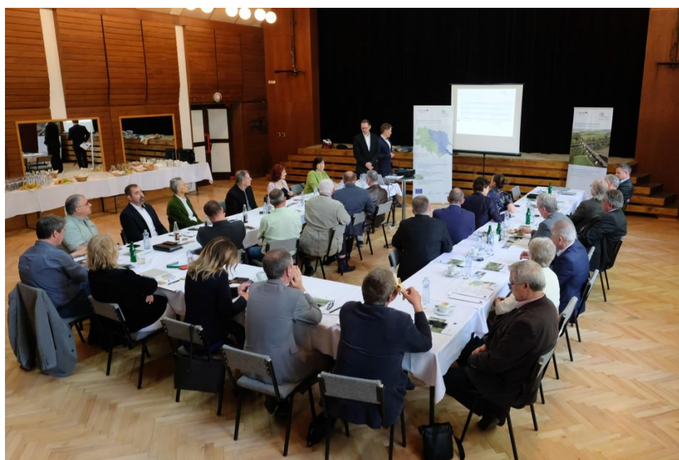
Účastníci stretnutia starostov v Devíne