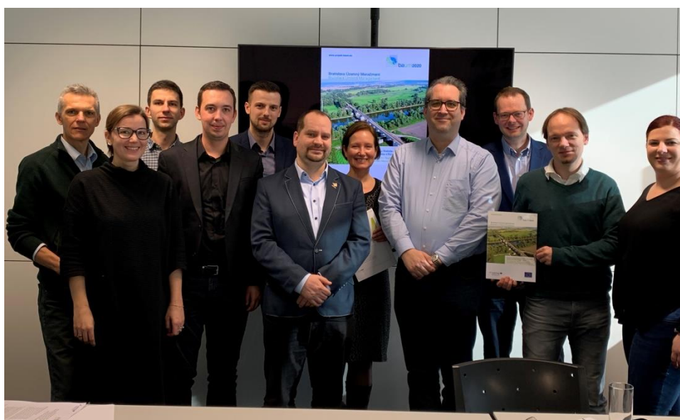
Pracovné stretnutie dopravných združení VOR a BID vo Viedni

Snahy o zachovanie autobusovej linky Bratislava-Hainburg: Autobusové spojenie Bratislava-Wolfsthal-Hainburg je v rámci cezhraničnej verejnej dopravy hlavnou tepnou medzi Hainburgom a Bratislavou. Koncom roka 2019 bola linka 901, ktorú dlhé roky financoval a prevádzkoval Dopravný podnik Bratislava, zrušená aj z dôvodu nerentabilnej prevádzky. Spojenie však plynulo prevzal súkromný poskytovateľ Slovak Lines. Linka zatiaľ nebola integrovaná do niektorého z dopravných združení, a preto sa na ňu nevzťahuje poskytovanie verejných dotácií; táto situácia je z hľadiska dlhodobého udržania linky neuspokojivá. Projekt baum2020 preto 23. januára 2020 zorganizoval vo Viedni stretnutie zamerané na koordináciu dopravných združení VOR a BID (Bratislava), ako aj mesta Bratislava. Záver: Spoločným cieľom je integrácia linky do jedného zo združení, a tým dosiahnutie dlhodobého (finančného) zabezpečenia cezhraničného autobusového spojenia. Uzavrela sa dohoda, že sa pre dosiahnutie cieľa budú počas roku 2020 koordinovane aktívne prijímať opatrenia na regionálnej a národnej úrovni.