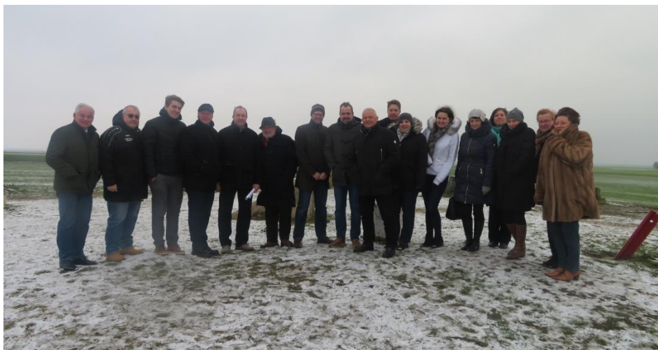
Zimná návšteva trojhrianičného bodu SK-AT-HU v rámci stretnutia starostov

19. decembra 2019 sa uskutočnilo slovensko-rakúske stretnutie starostov v obci Deutsch Jahrndorf v reštaurácii „Altes Landgut Werdenich“. Diskutovalo sa okrem iného aj o tom, aby sa zabezpečila udržateľnosť projektu baum2020 a nechýbala ani vzájomná správa o stavebných pozemkoch a stavebných projektoch v pohraničí. Hlavným bodom stretnutia však bola aj návšteva trojhrianičného bodu Rakúsko-Slovensko-Maďarsko, ktorý sa nachádza na území obce Deutsch Jahrndorf. V priestore trojhrianičného bodu je park sôch z 90-tych rokov 20. storočia – spoločným cieľom obce Deutsch Jahrndorf a susednej mestskej časti Bratislava-Čunovo je zatraktívniť tento priestor pre návštevníkov.