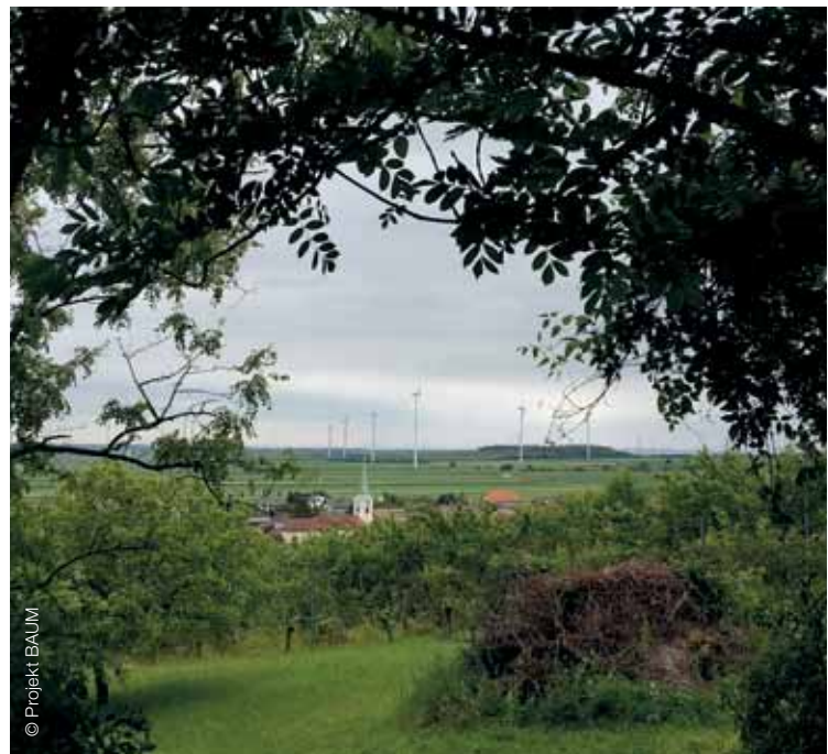
Trojhraničný bod AT-SK-HU Dreiländereck AT-SK-HU