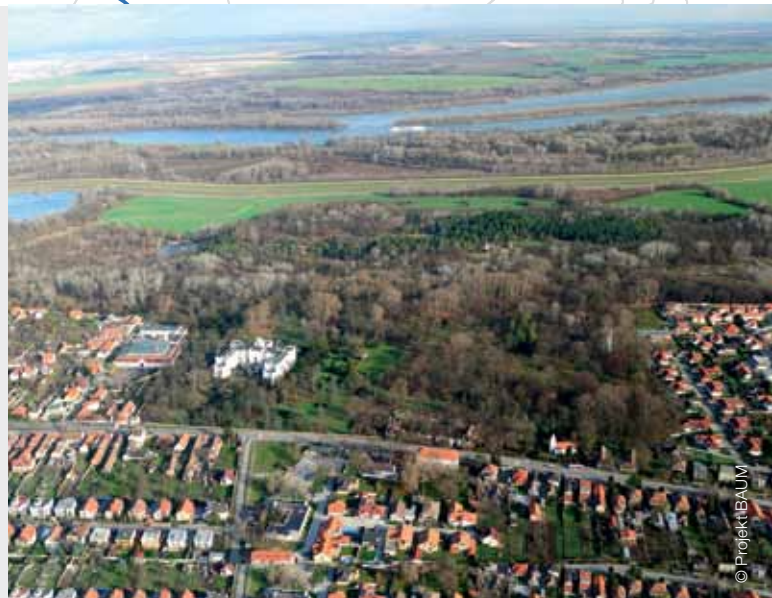
Bratislava – mestská časť Rusovce