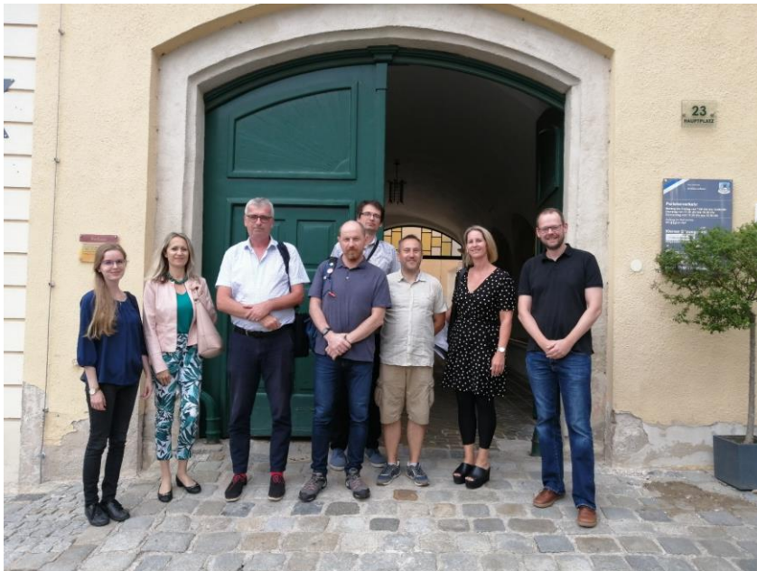
Pracovné stretnutie 27.06.2023 na radnici v Hainburgu